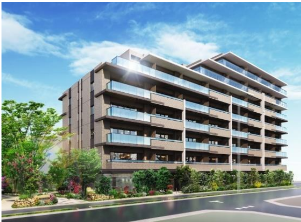
▲外観 イメージパース

外観は、緑豊かな朝霞のイメージを連想させるアースカラータイルとガラスの手すりを交互に配したバルコニーや、空に垂直に伸びる伸びやかな白いマリオンなど、区画整理地の新しい顔となる外観デザインを計画しています。