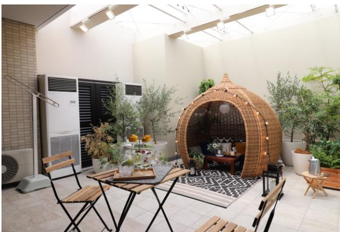
奥行き最大 6.1m の開放的なテラス （モデルルーム写真）