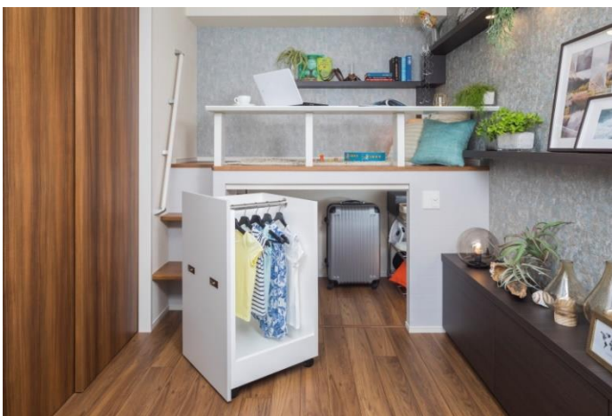
ハウスブランドオリジナル収納 「コアクロ」 （モデルルーム写真）