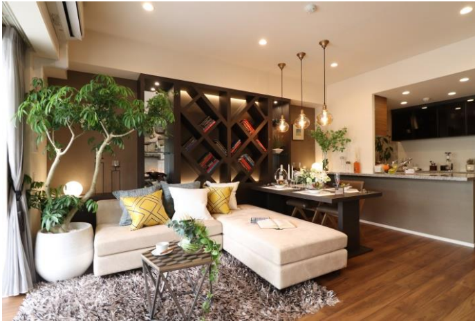
リビング（モデルルーム写真）