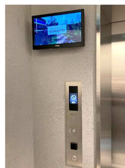
エレベーターホール （東京エレビGO）