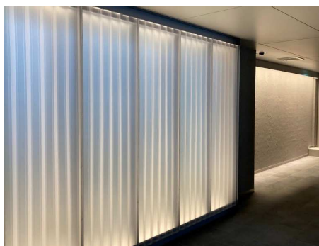
エントランスホール（光壁）