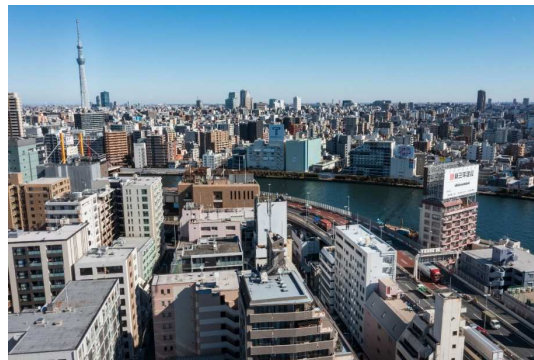
「バウスフラッツ日本橋浜町」周辺

東京駅や新宿駅、渋谷駅へのアクセスも良好なエリアであることから、職住近接志向の単身者、DINKS 世帯向けの賃貸住宅として計画、建設を進めてきました。